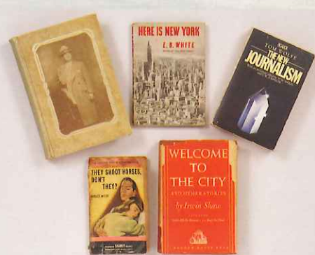
愛読した原書 個人蔵