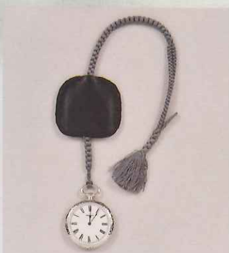
直木賞正賞の時計 1987年 個人蔵