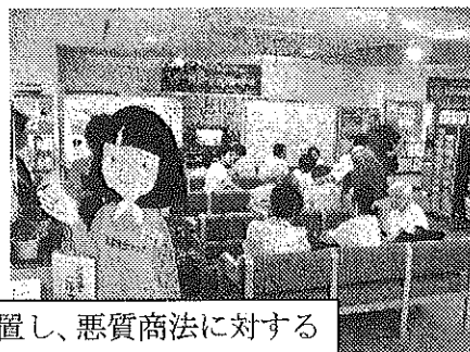
休憩コーナーにテレビを設置し、悪質商法に対する注意喚起のDVDを流しました。