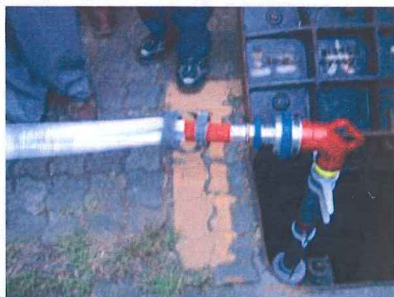
(ホースセッティング)