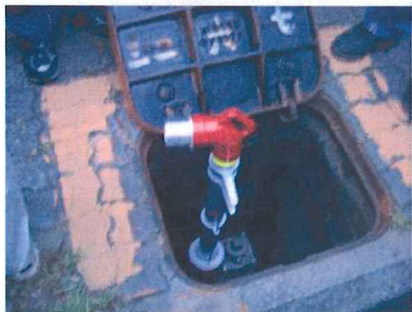
(スタンドパイプセッティング)